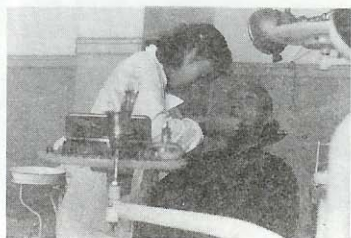
初期站著治療之情況